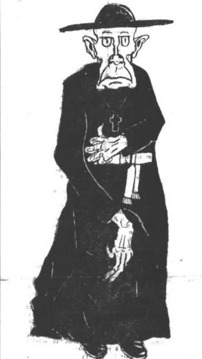
— Tremel, ó vós que ousastes pôr em dúvida a santidade dos Faustinos!...

(O APOCALIPSE HA DOIS MIL ANOS E O PROFETA JULIO NO SÉCULO XX).